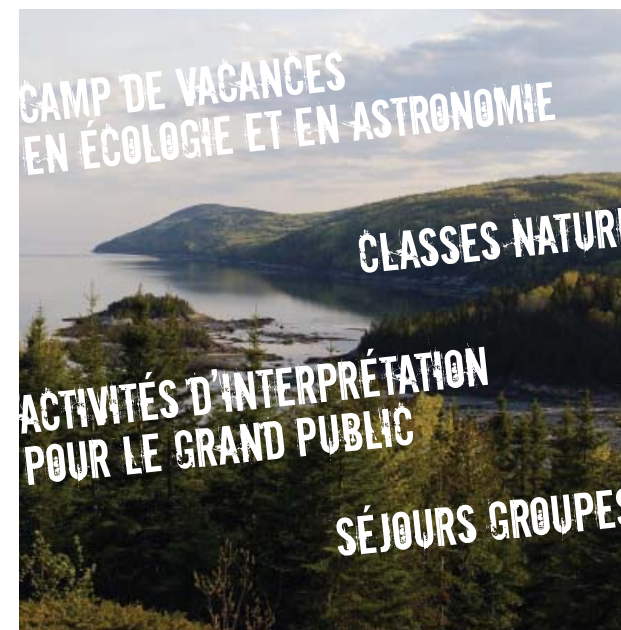
Ce dépliant imprimé avec des encres à base végétale est recyclable et contient 100% de fibres postconsommation • Corsaire design édition