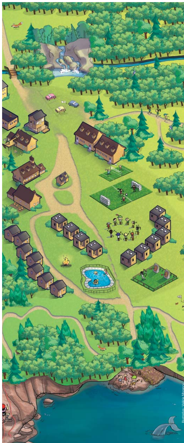
Illustration: Valérie Morancy